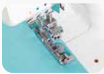
Piedino per punto catenella