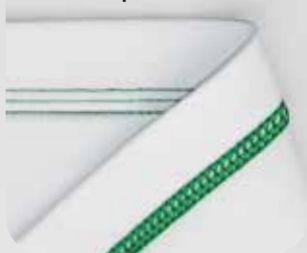
Punto copertura a 4 fili