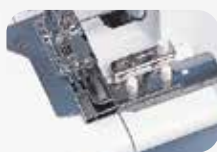
Guida per orlatrice (per punto copertura)