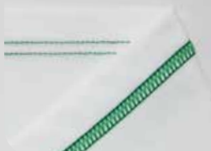
Punto copertura a 3 fili (largo)