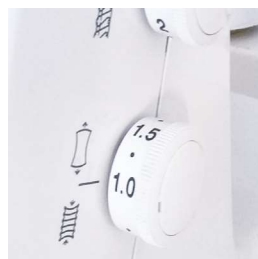
Regolazione trasp. differenziale