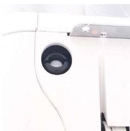
Regolazione pressione piedino