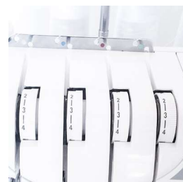
Regolazione delle tensioni