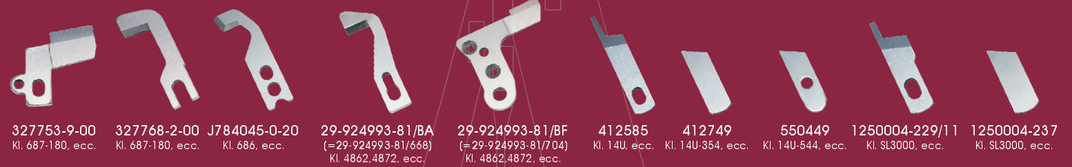
327753-9-00 Kl. 687-180, ecc. 327768-2-00 Kl. 687-180, ecc. J784045-0-20 Kl. 686, ecc. 29-924993-81/BA (=29-924993-81/668) Kl. 4862,4872, ecc. 29-924993-81/BF (=29-924993-81/704) Kl. 4862,4872, ecc. 412585 Kl. 14U, ecc. 412749 Kl. 14U-354, ecc. 550449 Kl. 14U-544, ecc. 1250004-229/11 Kl. SL3000, ecc. 1250004-237 Kl. SL3000, ecc.