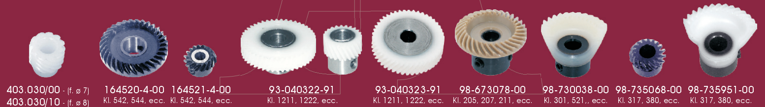
403.030/00 - (f. ø 7) 164520-4-00 Kl. 542, 544, ecc. 164521-4-00 Kl. 542, 544, ecc. 93-040322-91 Kl. 1211, 1222, ecc. 93-040323-91 Kl. 1211, 1222, ecc. 98-673078-00 Kl. 205, 207, 211, ecc. 98-730038-00 Kl. 301, 521,, ecc. 98-735068-00 Kl. 317, 380, ecc. 98-735951-00 Kl. 317, 380, ecc.