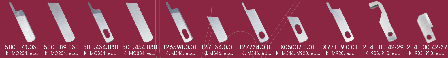
500.178.030 Kl. MO234, ecc. 500.189.030 Kl. MO234, ecc. 501.434.030 Kl. MO334, ecc. 501.454.030 Kl. MO334, ecc. 126598.0.01 Kl. M546, ecc. 127134.0.01 Kl. M546, ecc. 127734.0.01 Kl. M546, ecc. X05007.0.01 Kl. M546, M920, ecc. X77119.0.01 Kl. M920, ecc. 2141 00 42-29 Kl. 905, 910, ecc. 2141 00 42-37 Kl. 905, 910, ecc.