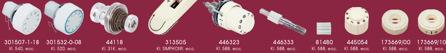
301507-1-18 Kl. 540, ecc. 301532-0-08 Kl. 520, ecc. 44118 Kl. 31K, ecc. 313505 Kl. SIMPHONY, ecc. 446323 Kl. 588, ecc. 446333 Kl. 588, ecc. 81480 Kl. 588, ecc. 445054 Kl. 588, ecc. 173669/00 Kl. 588, ecc. 173669/10 Kl. 588, ecc.