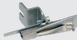
cod. 720/..1200 - guidanastro cpl (specificare mis. beccuccio) - ribbon guide asm. (specify spout size)