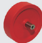
cod. 720/..1462 - rullo mm 18 cod. 720/..1705 - rullo mm 25 cod. 720/..1706 - rullo mm 30