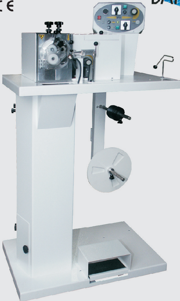
cod. BAF/310 - profilatrice al termoplastico - piping thermoplastic machine