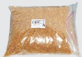
cod. 710/..77120 - termoplastico - 1Kg - thermoplastic - 1Kg