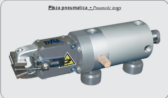
Pinza pneumatica - Pneumatic tongs

cod. BAF/903A - pinza pneumatica cpl. - pneumatic tongs asm.