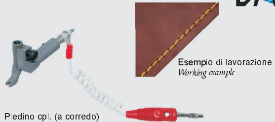
Piedino cpl. (a corredo) Foot asm. (equipped)

cod. BAF/6505 - marcapunto senza piedino - stitch marker without foot