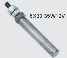
cod. 6517 - resistenza - resistance