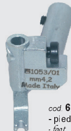
cod. 6510 - piedino - foot