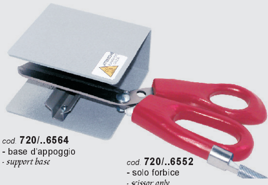
cod. 720/..6564 - base d'appoggio - support base