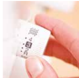
Regolazione della lunghezza del punto