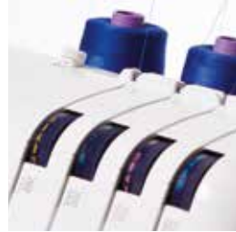
Facile guida all' infilatura con quattro colori