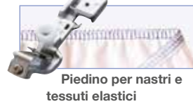
Piedino per nastri e tessuti elastici