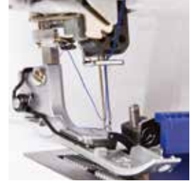
Infilatore automatico degli aghi