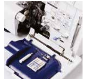
Vano accessori incorporato