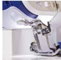
Piano illuminato con LED