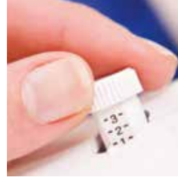
Regolazione della pressione del piedino