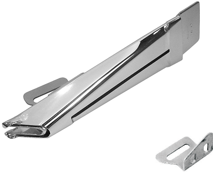
F704A - staffa - bracket

For: ADLER 467-AE73, PFAFF 1425-731 with thread trimmer