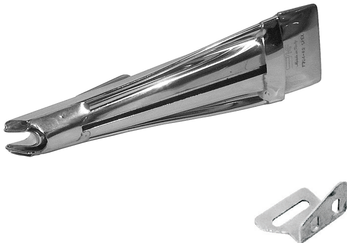
F704A - staffa - bracket

For: ADLER 467-AE73, PFAFF 1425-731 with thread trimmer