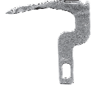
inferiore cod. 327219-0-00 (= 327339-0-00)