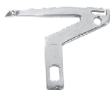
inferiore cod. A2005 1000