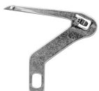
inferiore cod. 327761-9-00