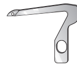
inferiore cod. 29-924993-70/521