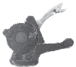
superiore cod. 398257-0-00