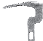
inferiore cod. ....