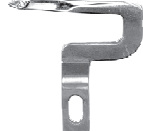
inferiore cod. 398254-0-00