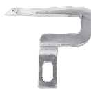
inferiore cod. 315