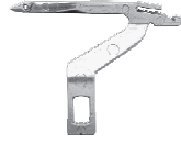
inferiore cod. 327560-3-00 (= 398269-0-00)